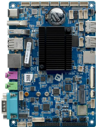
RK35B VER1.0 主板正面图